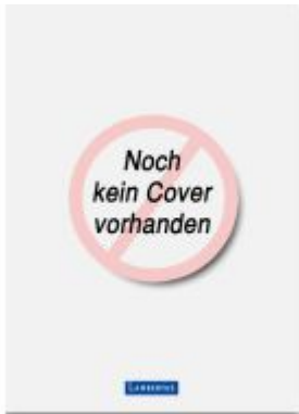
Schriftenreihe zum Kirchlichen Arbeitsrecht - Band 15 Ladenpreis: 61,60EUR