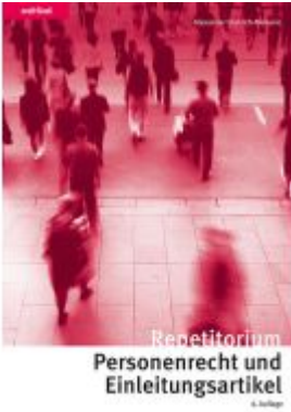
Repetitorium Personenrecht und Einleitungsartikel Ladenpreis: 65,80EUR