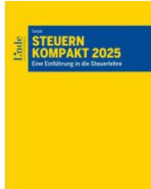
Steuern kompakt 2025 Ladenpreis: 35,00EUR