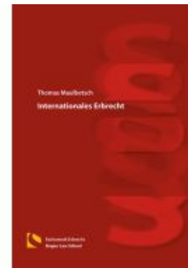
Internationales Erbrecht Ladenpreis: 25,70EUR