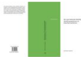
Der querstehende Beteiligte Ladenpreis: 49,50EUR