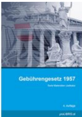
Gebührengesetz 1957 Ladenpreis: 26,00EUR