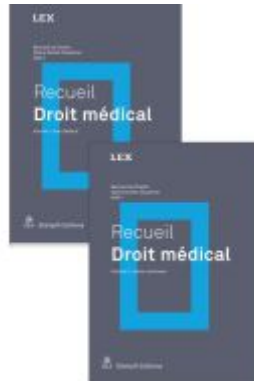
Recueil Droit médical Ladenpreis: 158,80EUR