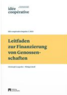
Leitfaden zur Finanzierung von Genossenschaften Ladenpreis: 42,00EUR