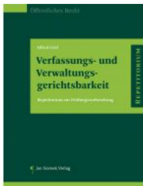
Verfassungs- und Verwaltungsgerichtsbarkeit Ladenpreis: 24,90 EUR