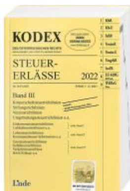
KODEX Steuer-Erlässe 2022 Band III Ladenpreis: 61,00 EUR