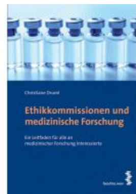
Ethikkommissionen und medizinische Forschung Ladenpreis: 14,90 EUR