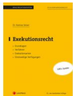
Exekutionsrecht (Skriptum) Ladenpreis: 21,00 EUR