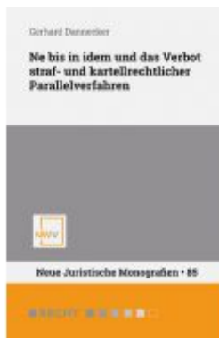
Ne bis in idem und das Verbot straf- und kartellrechtlicher Parallelverfahren Ladenpreis: 62,00 EUR