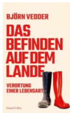
Das Befinden auf dem Lande. Verortung einer Lebensart Ladenpreis: 22,70EUR