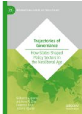
Trajectories of Governance Ladenpreis: 164,99EUR