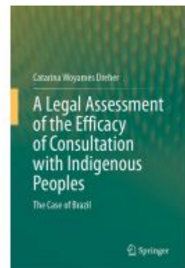
A Legal Assessment of the Efficacy of Consultation with Indigenous Peoples Ladenpreis: 131,99EUR