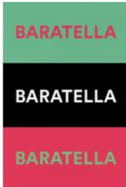
Immer wieder Baratella Ladenpreis: 48,00EUR

Wir haben andere Produkte gefunden, die Ihnen gefallen könnten!