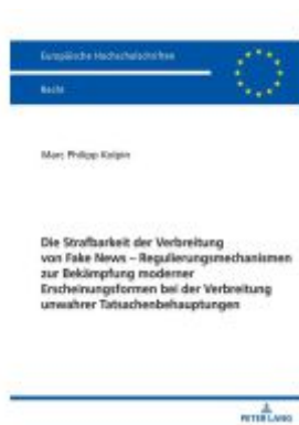
Die Strafbarkeit der Verbreitung von Fake News – Regulierungsmechanismen zur Bekämpfung moderner Erscheinungsformen bei der Verbreitung unwahrer Tatsachenbehauptungen Ladenpreis: 113,10EUR