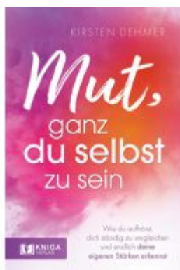
Mut, ganz du selbst zu sein Ladenpreis: 19,99EUR