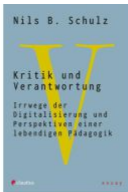
Kritik und Verantwortung Ladenpreis: 20,60EUR