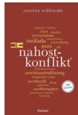
Nahostkonflikt. 100 Seiten Ladenpreis: 10,30EUR