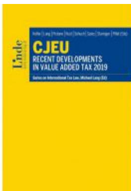
CJEU - Recent Developments in Value Added Tax 2019 Ladenpreis: 88,00 EUR