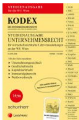
KODEX Unternehmensrecht für wirtschaftsrechtliche LVA 2021/22 - inkl. App Ladenpreis: 19,50 EUR