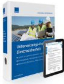
Unterweisungs-Vorlagen Elektrosicherheit Ladenpreis: 207,90 EUR

Wir haben andere Produkte gefunden, die Ihnen gefallen könnten!