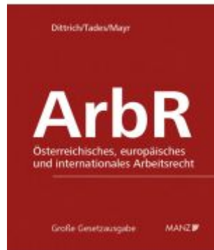
Arbeitsrecht Ladenpreis: 338,00 EUR