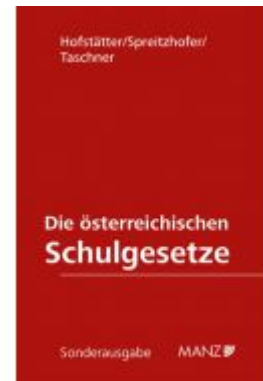
Die österreichischen Schulgesetze Ladenpreis: 248,00 EUR