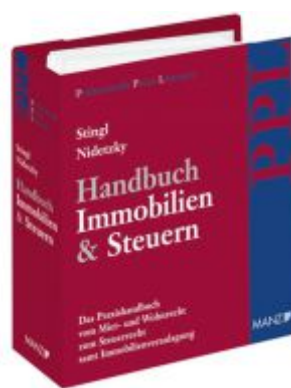
Handbuch Immobilien & Steuern Ladenpreis: 198,00 EUR