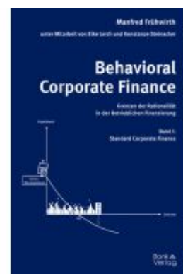
Behavioral Corporate Finance - Grenzen der Rationalität in der Betrieblichen Finanzierung Aktionspreis: 37,60 EUR Ladenpreis: 47,00 EUR