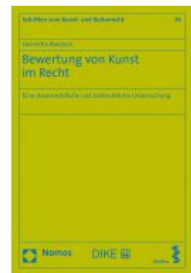
Bewertung von Kunst im Recht Ladenpreis: 77,10 EUR