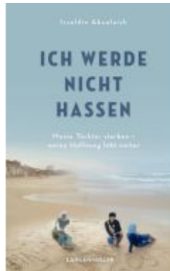
Ich werde nicht hassen Ladenpreis: 20,60EUR