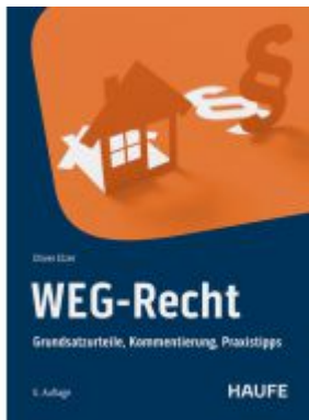
WEG-Recht Ladenpreis: 72,00EUR

Wir haben andere Produkte gefunden, die Ihnen gefallen könnten!