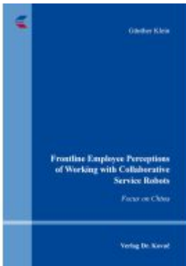
Frontline Employee Perceptions of Working with Collaborative Service Robots Ladenpreis: 76,90EUR