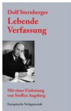
Lebende Verfassung Ladenpreis: 18,50EUR