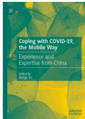
Coping with COVID-19, the Mobile Way Ladenpreis: 153,99EUR