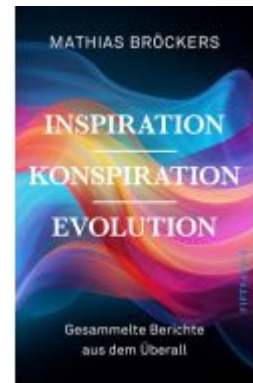
Inspiration, KONSPIRATION, Evolution Ladenpreis: 30,90EUR