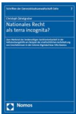
Nationales Recht als terra incognita?