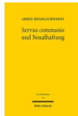
Servus communis und Noxalhaftung