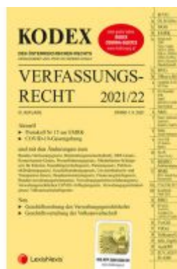
KODEX Verfassungsrecht 2021/22 - inkl. App Ladenpreis: 40,00 EUR