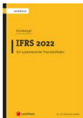
IFRS 2022 Ladenpreis: 42,00 EUR