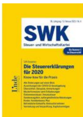
Die Steuererklärungen für 2020 Ladenpreis: 42,00 EUR