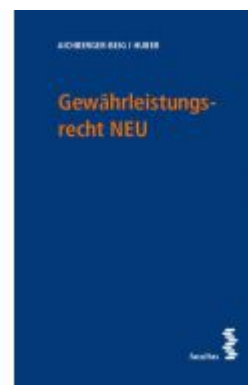
Gewährleistungsrecht NEU Ladenpreis: 54,00 EUR