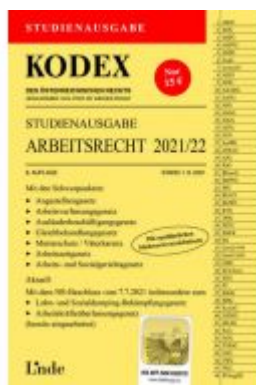
KODEX Studienausgabe Arbeitsrecht 2021/22 Ladenpreis: 15,00 EUR