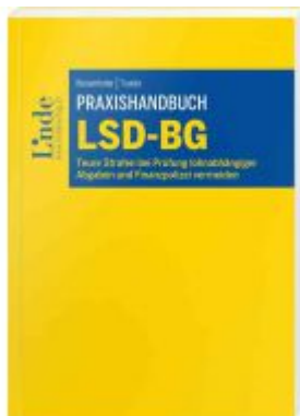
Praxishandbuch LSD-BG Ladenpreis: 42,00 EUR

Wir haben andere Produkte gefunden, die Ihnen gefallen könnten!