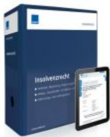
Insolvenzrecht Ladenpreis: 228,90 EUR