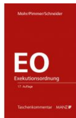
Exekutionsordnung - EO Ladenpreis: 108,00 EUR