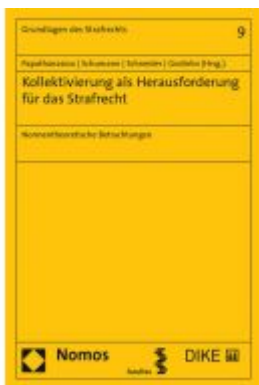
Kollektivierung als Herausforderung für das Strafrecht Ladenpreis: 43,20 EUR