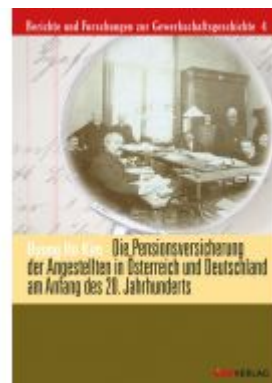
Die Pensionsversicherung der Angestellten in Österreich und Deutschland am Anfang des 20. Jahrhunderts Ladenpreis: 36,00 EUR