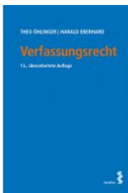
Verfassungsrecht Ladenpreis: 46,00 EUR