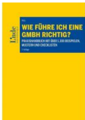
Wie führe ich eine GmbH richtig? Ladenpreis: 168,00 EUR