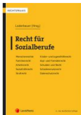
Recht für Sozialberufe Ladenpreis: 62,00 EUR