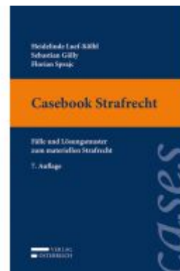
Casebook Strafrecht Ladenpreis: 36,00 EUR