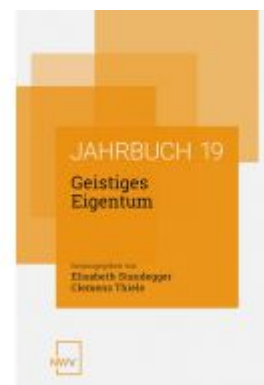
Geistiges Eigentum Ladenpreis: 68,00EUR