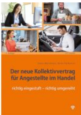
Der neue Kollektivvertrag für Angestellte im Handel Ladenpreis: 36,75EUR