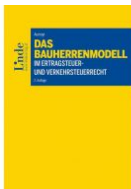
Das Bauherrenmodell im Ertragsteuer- und Verkehrssteuerrecht Ladenpreis: 59,00EUR