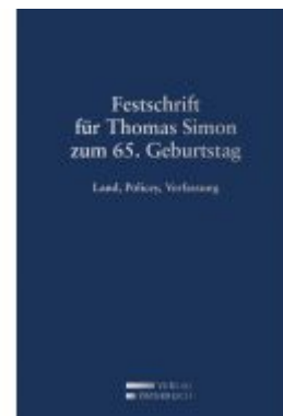
Festschrift für Thomas Simon zum 65. Geburtstag Ladenpreis: 109,00EUR