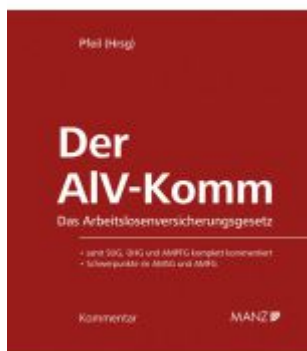
Der AIV-Komm Das Arbeitslosenversicherungsgesetz Ladenpreis: 198,00EUR

Wir haben andere Produkte gefunden, die Ihnen gefallen könnten!