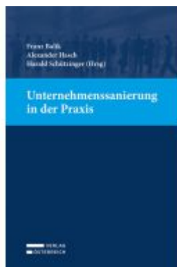
Unternehmensanierung in der Praxis Ladenpreis: 69,00EUR