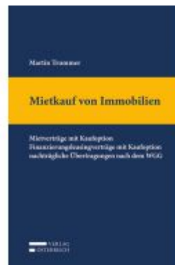
Mietkauf von Immobilien Ladenpreis: 109,00EUR