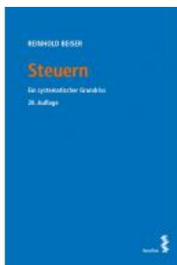
Steuern Ladenpreis: 50,00EUR