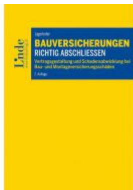
Bauversicherungen richtig abschließen Ladenpreis: 64,00EUR