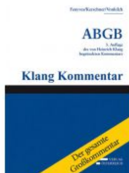
Großkommentar zum ABGB - Klang Kommentar Ladenpreis: 5.166,00EUR