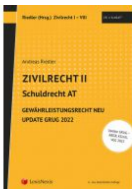
Zivilrecht II - Update GRUG 2022 Ladenpreis: 5,00EUR