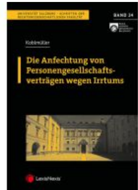
Die Anfechtung von Personengesellschaftsverträgen wegen Irrtums Ladenpreis: 32,00EUR