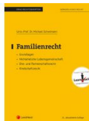
Familienrecht (Skriptum) Ladenpreis: 23,75EUR