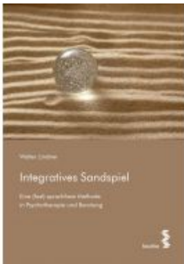
Integratives Sandspiel Ladenpreis: 21,90EUR