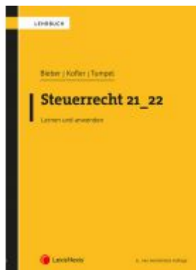
Steuerrecht 21_22 Ladenpreis: 69,00EUR