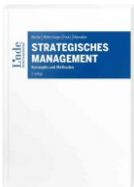
Strategisches Management Ladenpreis: 40,00EUR

Wir haben andere Produkte gefunden, die Ihnen gefallen könnten!