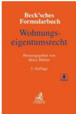
Beck'sches Formularbuch Wohnungseigentumsrecht Ladenpreis: 173,80EUR