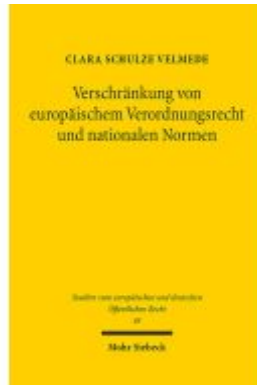
Verschränkung von europäischem Verordnungsrecht und nationalen Normen Ladenpreis: 91,50EUR