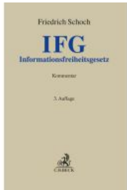
Informationsfreiheitsgesetz Ladenpreis: 184,10EUR