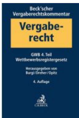
Beck'scher Vergaberechtskommentar Band 1: Gesetz gegen Wettbewerbsbeschränkungen - GWB - 4. Teil, Wettbewerbsregistergesetz Ladenpreis: 276,60EUR