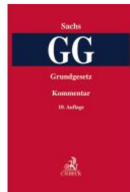
Grundgesetz Ladenpreis: 245,70EUR