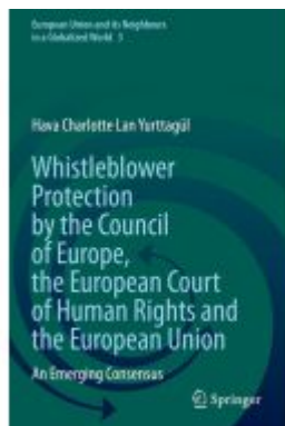
Whistleblower Protection by the Council of Europe, the European Court of Human Rights and the European Union Ladenpreis: 131,99EUR

Wir haben andere Produkte gefunden, die Ihnen gefallen könnten!