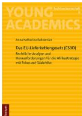
Das EU-Lieferkettengesetz (CS3D) Ladenpreis: 35,00EUR