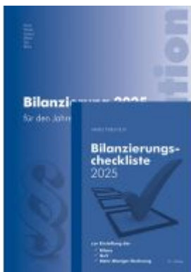
Kombi-Paket Bilanzierung 2025 Ladenpreis: 60,00EUR