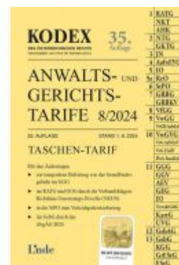
KODEX Anwalts- und Gerichtstarife 8/2024 Ladenpreis: 35,00EUR