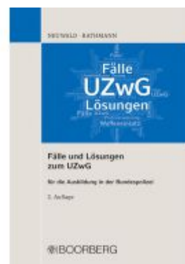
Fälle und Lösungen zum UZwG Ladenpreis: 25,60EUR