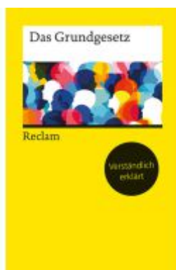
Das Grundgesetz. Verständlich erklärt von Alexander Thiele Ladenpreis: 8,30EUR