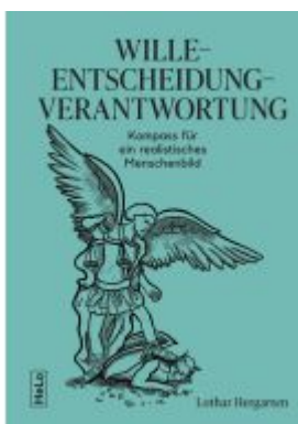
Wille-Entscheidung-Verantwortung Ladenpreis: 28,00EUR