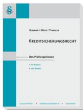
Kreditsicherungsrecht Ladenpreis: 23,60EUR