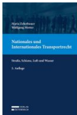
Nationales und Internationales Transportrecht Ladenpreis: 149,00EUR