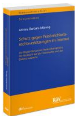
Schutz gegen Persönlichkeitsrechtsverletzungen im Internet Ladenpreis: 91,50EUR