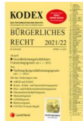
KODEX Bürgerliches Recht 2021/22 - inkl. App Ladenpreis: 36,00 EUR