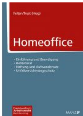
Homeoffice Ladenpreis: 79,00 EUR