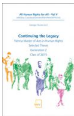
Continuing the Legacy Ladenpreis: 58,00 EUR