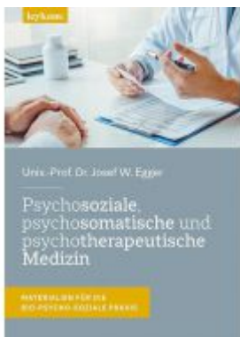
Psychosoziale, psychosomatische und psychotherapeutische Medizin Ladenpreis: 39,00 EUR

Wir haben andere Produkte gefunden, die Ihnen gefallen könnten!