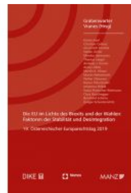
Die EU im Lichte des Brexits und der Wahlen Europarechtstag 2019 Ladenpreis: 58,00 EUR