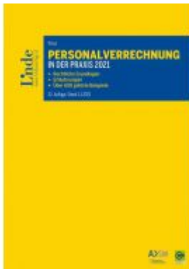
Personalverrechnung in der Praxis 2021 Ladenpreis: 105,00 EUR