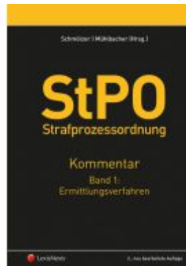
StPO Strafprozessordnung - Kommentar Band 1: Ermittlungsverfahren Ladenpreis: 292,00 EUR