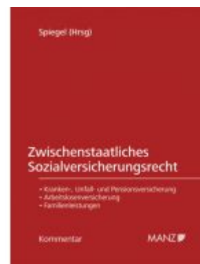
Zwischenstaatliches Sozialversicherungsrecht Ladenpreis: 198,00 EUR