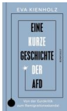
Eine kurze Geschichte der AfD Ladenpreis: 18,50EUR