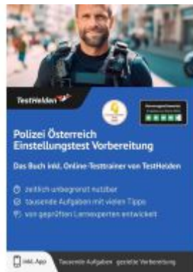
Polizei Österreich Einstellungstest Vorbereitung: Das Buch inkl. Online-Testtrainer von TestHelden Ladenpreis: 40,30EUR