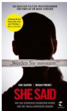
She Said Ladenpreis: 12,40EUR