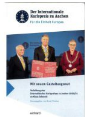
Mit neuem Gestaltungsmut Ladenpreis: 15,00EUR