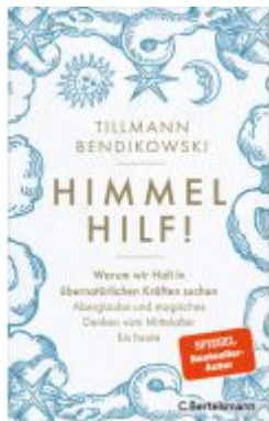
Himmel hilf! Ladenpreis: 25,70EUR