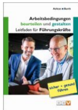
Arbeitsbedingungen beurteilen und gestalten Ladenpreis: 13,30EUR