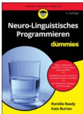
Neuro-Linguistisches Programmieren für Dummys Ladenpreis: 22,70EUR