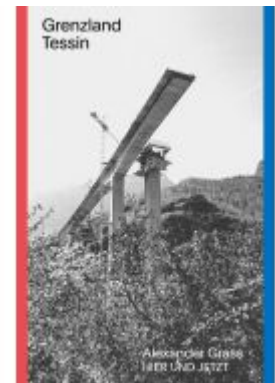
Grenzland Tessin Ladenpreis: 40,10EUR