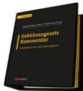
Gebührengesetz Kommentar Ladenpreis: 282,00EUR