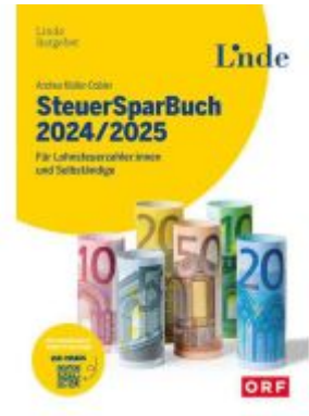
SteuerSparBuch 2024/2025 Ladenpreis: 34,00EUR