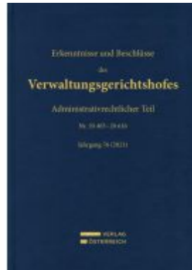
Erkenntnisse und Beschlüsse des Verwaltungsgerichtshofes Ladenpreis: 549,00EUR