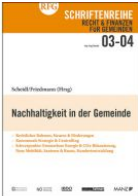
Nachhaltigkeit in der Gemeinde Ladenpreis: 34,80EUR