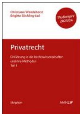
Privatrecht Einführung in die Rechtswissenschaften und ihre Methoden: Teil II Ladenpreis: 15,40EUR