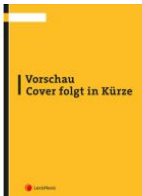
Der Verein im Steuerrecht Ladenpreis: 35,00EUR

Wir haben andere Produkte gefunden, die Ihnen gefallen könnten!