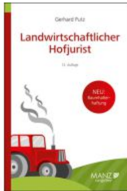
Landwirtschaftlicher Hofjurist Ladenpreis: 26,80EUR