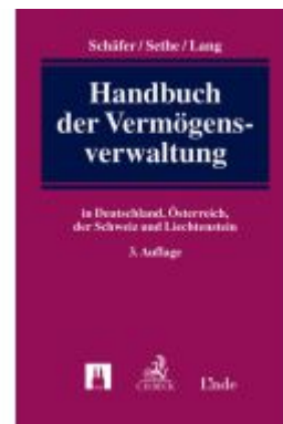
Handbuch der Vermögensverwaltung Ladenpreis: 249,00EUR