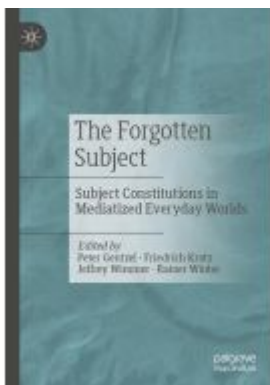
The Forgotten Subject Ladenpreis: 87,99EUR