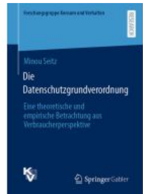
Die Datenschutzgrundverordnung Ladenpreis: 77,09EUR