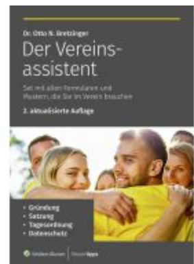
Der Vereinsassistent Ladenpreis: 16,40EUR