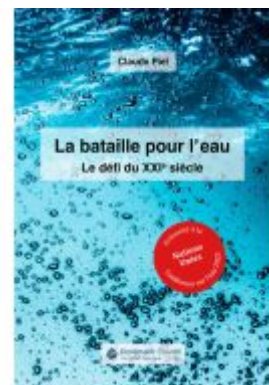
La bataille pour l'eau Ladenpreis: 24,70EUR