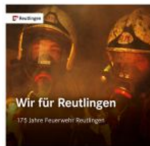
Wir für Reutlingen. 175 Jahre Feuerwehr Reutlingen Ladenpreis: 15,40EUR