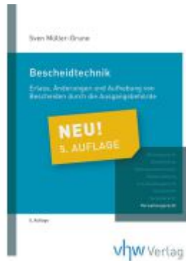
Bescheidtechnik Ladenpreis: 30,80EUR