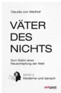
Väter des Nichts Ladenpreis: 30,80EUR