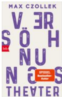
Versöhnungstheater Ladenpreis: 13,40EUR

Wir haben andere Produkte gefunden, die Ihnen gefallen könnten!