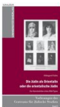
Die Jüdin als Orientalin oder die orientalische Jüdin Ladenpreis: 9,90 EUR