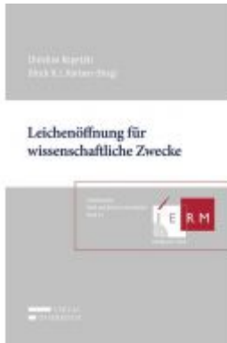
Leichenöffnung für wissenschaftliche Zwecke Ladenpreis: 58,00 EUR