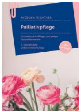
Palliativpflege Ladenpreis: 28,90 EUR