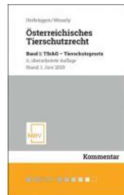
Österreichisches Tierschutzrecht Ladenpreis: 98,00 EUR