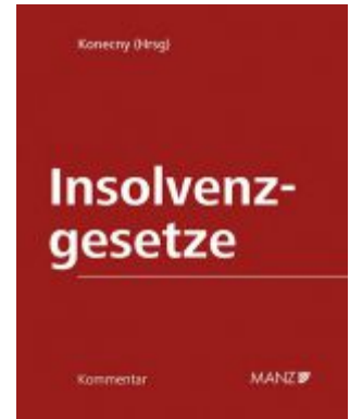
Kommentar zu den Insolvenzgesetzen Ladenpreis: 380,00 EUR