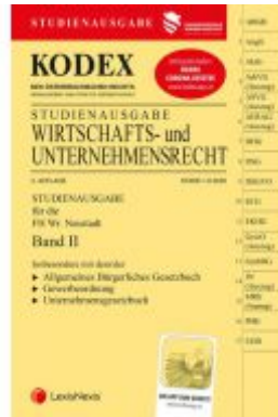
KODEX Wirtschafts- und Unternehmensrecht 2020 Band II Ladenpreis: 22,50 EUR