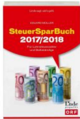
SteuerSparBuch 2017/2018 Ladenpreis: 29,90 EUR