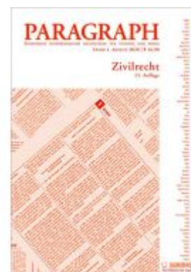
Paragraph - Zivilrecht Ladenpreis: 16,90 EUR