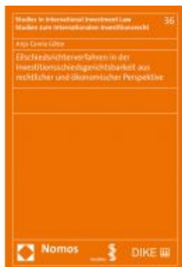
Eilschiedsrichterverfahren in der Investitionsschiedsgerichtsbarkeit aus rechtlicher und ökonomischer Perspektive Ladenpreis: 74,00 EUR