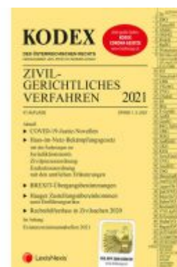
KODEX Zivilgerichtliches Verfahren 2021 Ladenpreis: 40,00 EUR