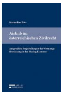
Airbnb im österreichischen Zivilrecht Ladenpreis: 53,00 EUR