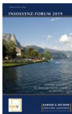
Insolvenz-Forum 2019 Ladenpreis: 54,80 EUR