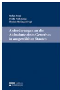
Anforderungen an die Aufnahme eines Gewerbes in ausgewählten Staaten Ladenpreis: 64,00 EUR