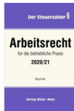
Arbeitsrecht für die betriebliche Praxis 2020/21 Ladenpreis: 85,80 EUR