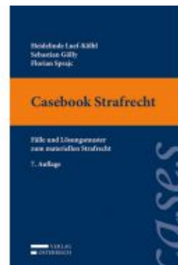
Casebook Strafrecht Ladenpreis: 36,00 EUR