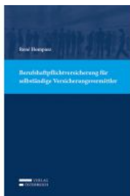
Berufshaftpflichtversicherung für selbständige Versicherungsvertreter Ladenpreis: 59,00 EUR