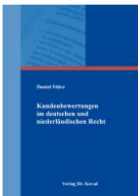
Haftung für Kundenbewertungen im deutschen und niederländischen Recht Ladenpreis: 102,60EUR