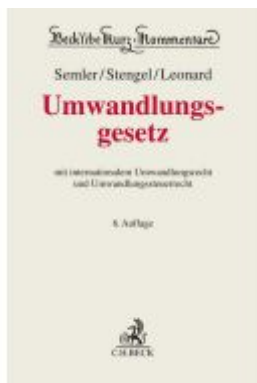
Umwandlungsgesetz Ladenpreis: 256,00EUR