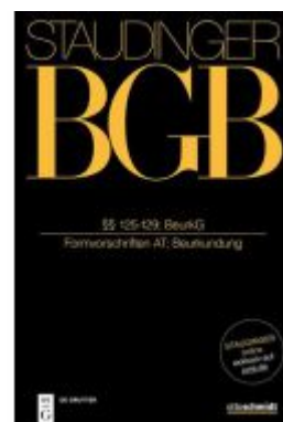
§§ 125-129; BeurkG Ladenpreis: 349,00EUR