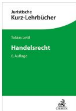
Handelsrecht Ladenpreis: 35,90EUR