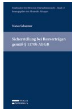
Sicherstellung bei Bauverträgen gemäß § 1170b ABGB Ladenpreis: 69,00EUR