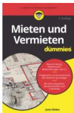
Mieten und Vermieten für Dummies Ladenpreis: 15,50EUR