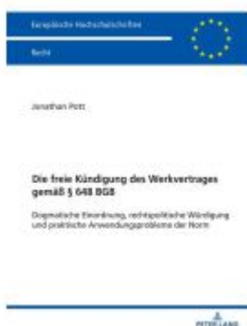
Die freie Kündigung des Werkvertrages gemäß § 648 BGB Ladenpreis: 51,40EUR