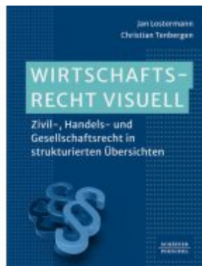
Wirtschaftsrecht visuell Ladenpreis: 51,40EUR