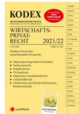
KODEX Wirtschaftsprivatrecht 2021/22 - inkl. App Ladenpreis: 29,80 EUR