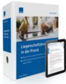
Liegenschaftsbewertung in der Praxis Ladenpreis: 207,90 EUR