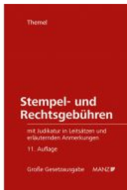
Stempel- und Rechtsgebühren Ladenpreis: 138,00 EUR