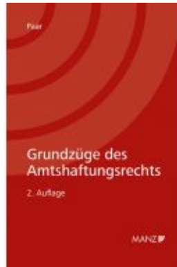
Grundzüge des Amtshaftungsrechts Ladenpreis: 36,00 EUR