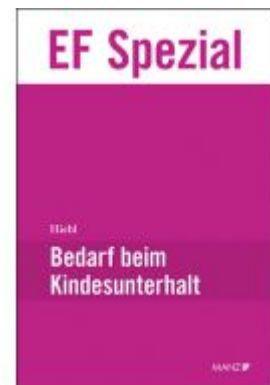
Bedarf beim Kindesunterhalt Ladenpreis: 74,00 EUR