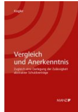
Vergleich und Anerkenntnis Ladenpreis: 84,00 EUR