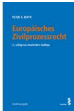
Europäisches Zivilprozessrecht Ladenpreis: 46,00 EUR