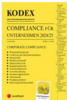
KODEX Compliance für Unternehmen 2024/25 - inkl. App Ladenpreis: 81,00EUR