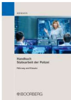
Handbuch Stabsarbeit der Polizei Ladenpreis: 40,10EUR