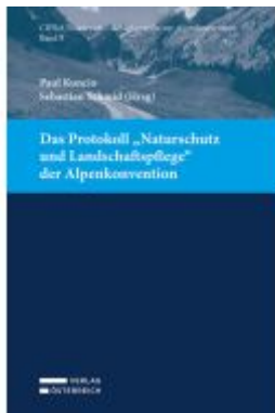
Das Protokoll „Naturschutz und Landschaftspflege“ der Alpenkonvention