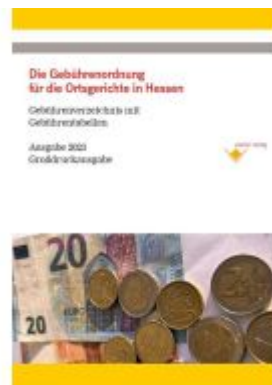
Die Gebührenordnung für die Ortsgerichte im Lande Hessen Ladenpreis: 19,10EUR