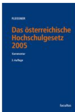
Das österreichische Hochschulgesetz 2005