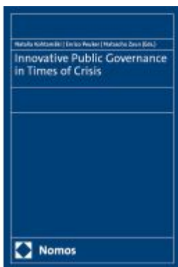
Innovative Public Governance in Times of Crisis Ladenpreis: 76,10EUR