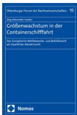
Größenwachstum in der Containerschifffahrt