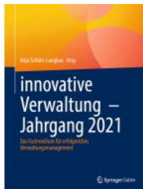
innovative Verwaltung – Jahrgang 2021 Ladenpreis: 66,81EUR