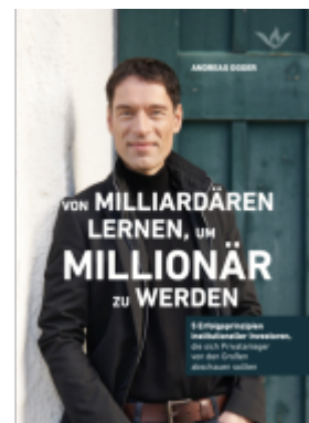
Von Milliardären lernen, um Millionär zu werden Ladenpreis: 19,60EUR