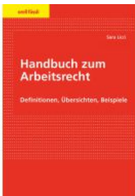
Handbuch zum Arbeitsrecht Ladenpreis: 71,00EUR