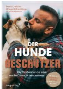
Der Hundebesitzer Ladenpreis: 18,60EUR