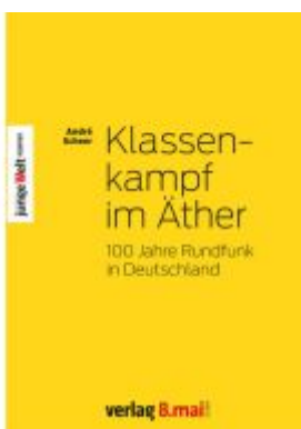
Klassenkampf im Äther Ladenpreis: 20,50EUR