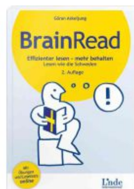
BrainRead Ladenpreis: 24,90EUR