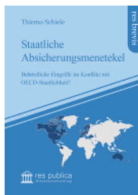
Staatliche Absicherungsmechanikel Ladenpreis: 22,00EUR