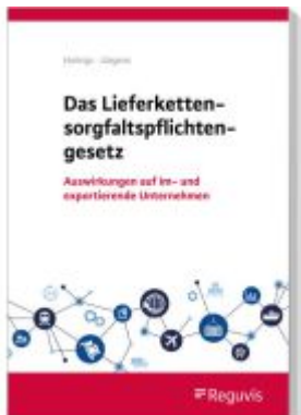
Das Lieferkettensorgfaltspflichtengesetz Ladenpreis: 51,20EUR

Wir haben andere Produkte gefunden, die Ihnen gefallen könnten!