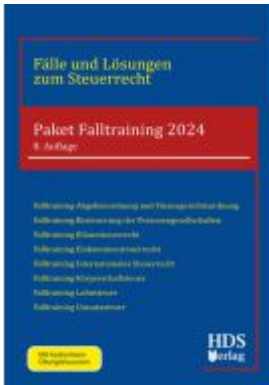
Paket Falltraining 2024 Ladenpreis: 374,60EUR