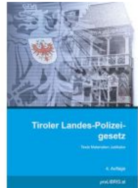
Tiroler Landes-Polizeigesetz Ladenpreis: 21,00EUR