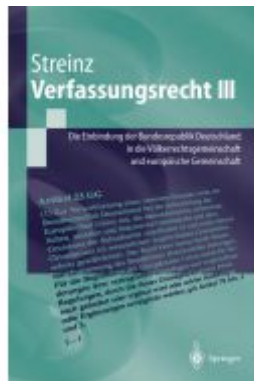
Verfassungsrecht III Ladenpreis: 20,51EUR