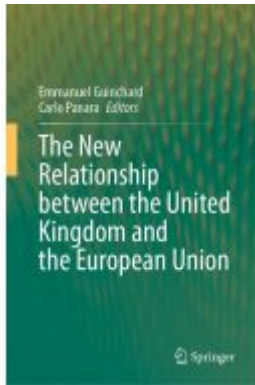
The New Relationship between the United Kingdom and the European Union Ladenpreis: 186,99EUR