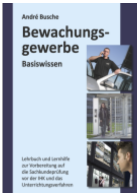
Basiswissen Sachkundeprüfung Bewachungsgewerbe § 34a GewO Ladenpreis: 23,60EUR

Wir haben andere Produkte gefunden, die Ihnen gefallen könnten!