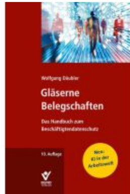
Gläserne Belegschaften Ladenpreis: 70,00EUR