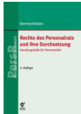
Rechte des Personalrats und ihre Durchsetzung Ladenpreis: 22,70EUR