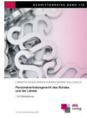
Personalvertretungsrecht des Bundes und der Länder Ladenpreis: 39,50EUR