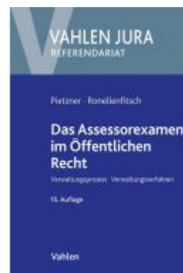
Das Assessorexamen im Öffentlichen Recht Ladenpreis: 41,20EUR