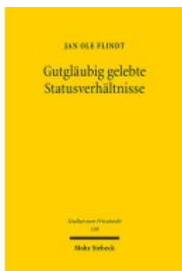
Gutgläubig gelebte Statusverhältnisse Ladenpreis: 96,70EUR