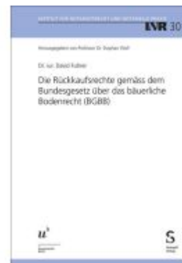
Die Rückkaufsrechte gemäss dem Bundesgesetz über das bäuerliche Bodenrecht (BGBB) Ladenpreis: 115,30EUR