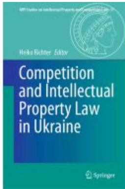
Competition and Intellectual Property Law in Ukraine Ladenpreis: 274,99EUR