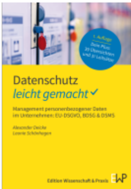
Datenschutz – leicht gemacht Ladenpreis: 17,40EUR