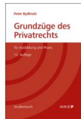
Grundzüge des Privatrechts Ladenpreis: 52,50EUR