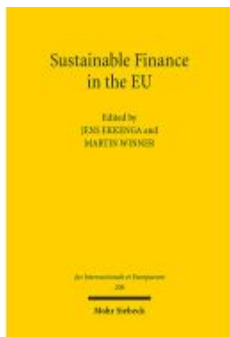
Sustainable Finance in the EU Ladenpreis: 91,50EUR