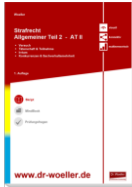
Skript - Strafrecht Allgemeiner Teil 2 - AT II Ladenpreis: 30,80EUR