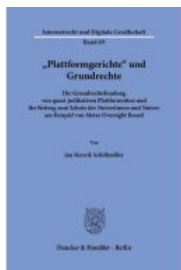
"Plattformgerichte" und Grundrechte Ladenpreis: 102,70EUR