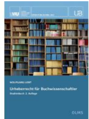
Urheberrecht für Buchwissenschaftler Ladenpreis: 46,20EUR