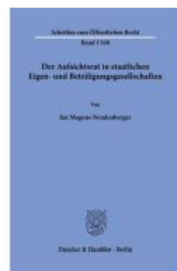
Der Aufsichtsrat in staatlichen Eigen- und Beteiligungsgesellschaften. Ladenpreis: 102,70EUR