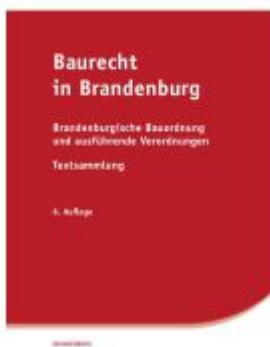
Baurecht in Brandenburg Ladenpreis: 20,50EUR