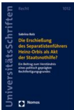
Die Erschießung des Separatistenführers Heinz-Orbis als Akt der Staatsnothilfe? Ladenpreis: 158,40EUR

Wir haben andere Produkte gefunden, die Ihnen gefallen könnten!