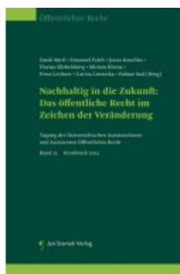
Nachhaltig in die Zukunft: Das öffentliche Recht im Zeichen der Veränderung Ladenpreis: 85,00EUR