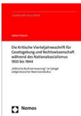
Die Kritische Vierteljahresschrift für Gesetzgebung und Rechtswissenschaft während des Nationalsozialismus 1933 bis 1944 Ladenpreis: 163,50EUR