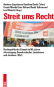
Streit ums Recht Ladenpreis: 20,40EUR