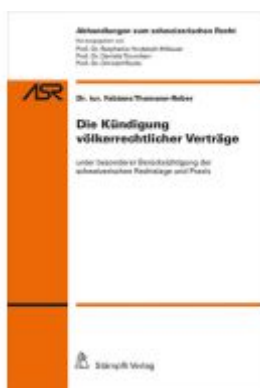
Die Kündigung völkerrechtlicher Verträge Ladenpreis: 116,40EUR