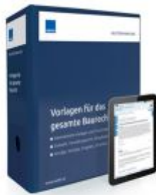
Vorlagen für das gesamte Baurecht Ladenpreis: 228,90 EUR