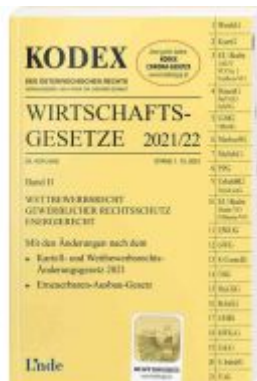
KODEX Wirtschaftsgesetze Band II 2021/22 Ladenpreis: 60,00 EUR