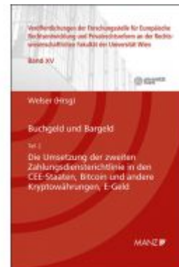
Buchgeld und Bargeld - Teil 2: Die Umsetzung der zweiten Zahlungsdienstrichtlinie in den CEE-Staaten Ladenpreis: 64,00 EUR