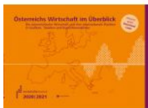
Österreichs Wirtschaft im Überblick 2020/21 Ladenpreis: 14,30 EUR