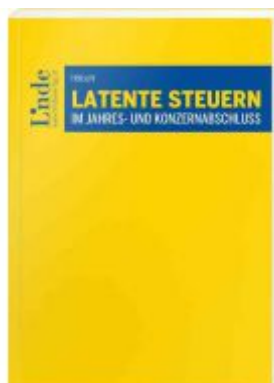
Latente Steuern im Jahres- und Konzernabschluss Ladenpreis: 66,00 EUR