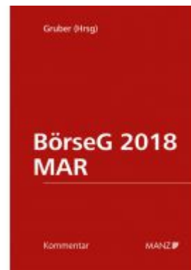
BörseG 2018/MAR Ladenpreis: 358,00 EUR