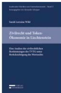
Zivilrecht und Token-Ökonomie in Liechtenstein Ladenpreis: 39,00 EUR