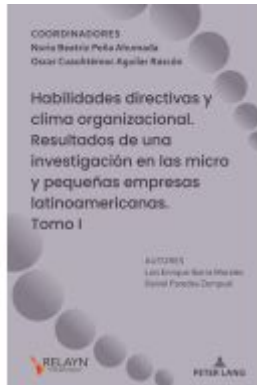
Habilidades directivas y clima organizacional. Resultados de una investigación en las micro y pequeñas empresas latinoamericanas