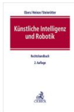
Künstliche Intelligenz und Robotik Ladenpreis: 225,20EUR