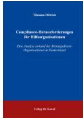
Compliance-Herausforderungen für Hilfsorganisationen