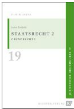
Juristische Grundkurse / Band 19 - Staatsrecht 2 Ladenpreis: 11,10EUR