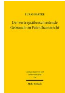
Der vertragsüberschreitende Gebrauch im Patentrecht