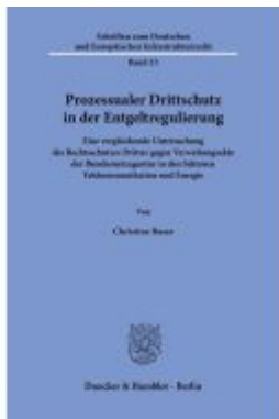
Prozessualer Drittschutz in der Entgeltregulierung. Ladenpreis: 123,30EUR