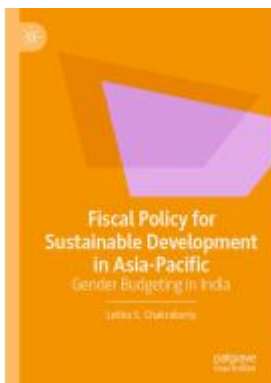
Fiscal Policy for Sustainable Development in Asia-Pacific Ladenpreis: 131,99EUR