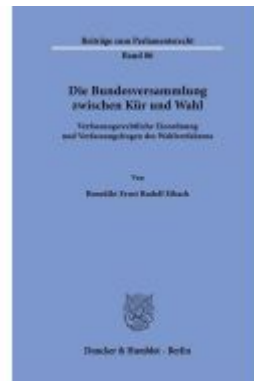
Die Bundesversammlung zwischen Kür und Wahl. Ladenpreis: 102,70EUR