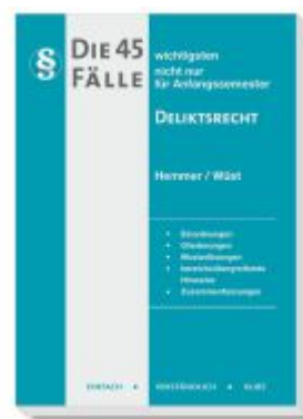
Die 45 wichtigsten Fälle Deliktsrecht Ladenpreis: 15,30EUR