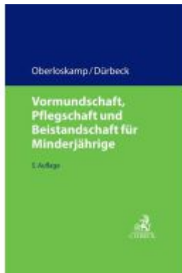
Vormundschaft, Pflegschaft und Beistandschaft für Minderjährige Ladenpreis: 97,70EUR