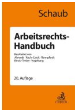
Arbeitsrechts-Handbuch Ladenpreis: 142,90EUR