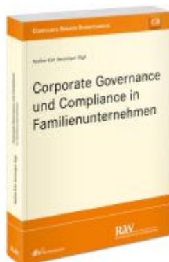
Corporate Governance und Compliance in Familienunternehmen Ladenpreis: 91,50EUR