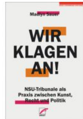
Wir klagen an! Ladenpreis: 16,50EUR