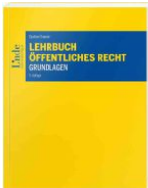
Lehrbuch Öffentliches Recht - Grundlagen Ladenpreis: 50,00EUR