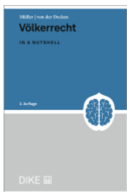
Völkerrecht Ladenpreis: 52,00EUR