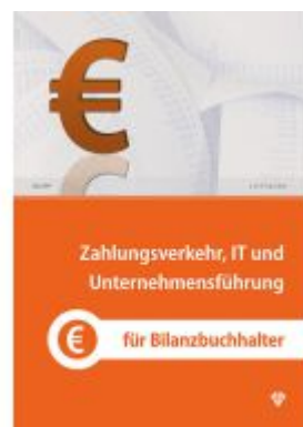
Zahlungsverkehr, IT und Unternehmensführung Ladenpreis: 39,00EUR