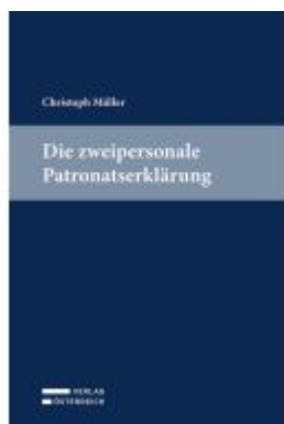
Die zweipersonale Patronatserklärung Ladenpreis: 89,00EUR