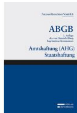
Großkommentar zum ABGB - Klang Kommentar Ladenpreis: 224,00EUR