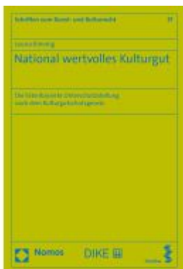
National wertvolles Kulturgut Ladenpreis: 139,90EUR

Wir haben andere Produkte gefunden, die Ihnen gefallen könnten!