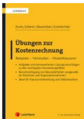
Übungen zur Kostenrechnung Ladenpreis: 39,00EUR