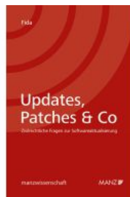
Updates, Patches & Co - Zivilrechtliche Fragen zur Softwareaktualisierung Ladenpreis: 59,00EUR