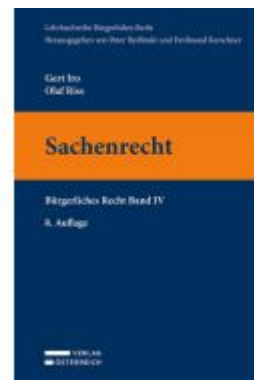
Sachenrecht Ladenpreis: 37,00EUR