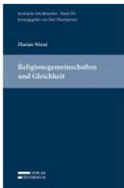
Religionsgemeinschaften und Gleichheit Ladenpreis: 145,00EUR