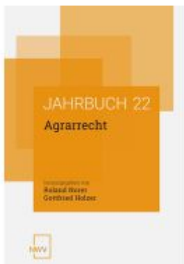
Agrarrecht Ladenpreis: 74,00EUR