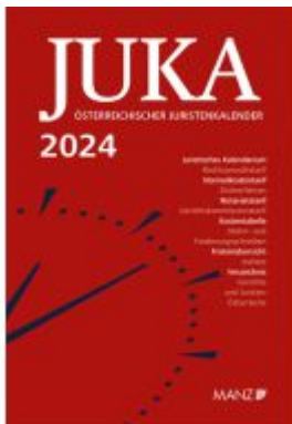
Österreichischer Juristenkalender 2024 JuKa Ladenpreis: 149,00EUR

Wir haben andere Produkte gefunden, die Ihnen gefallen könnten!