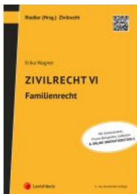
Zivilrecht VI - Familienrecht Ladenpreis: 37,00EUR