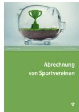
Abrechnung von Sportvereinen Ladenpreis: 27,50EUR