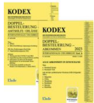
KODEX Doppelbesteuerung 2023 Ladenpreis: 71,00EUR