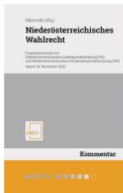
Niederösterreichisches Wahlrecht Ladenpreis: 118,00EUR