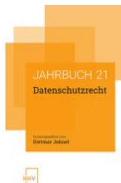
Datenschutzrecht Ladenpreis: 58,00EUR