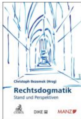
Rechtsdogmatik - Stand und Perspektiven Ladenpreis: 90,00EUR