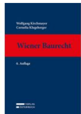
Wiener Baurecht Ladenpreis: 169,00EUR

Alle Preise inkl. MwSt. zzgl. Versand. Bei Bestellung im LexisNexis Onlineshop kostenloser Versand innerhalb Österreichs.