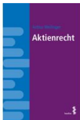
Aktienrecht Ladenpreis: 12,00EUR