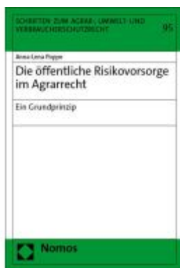
Die öffentliche Risikovorsorge im Agrarrecht Ladenpreis: 163,50EUR