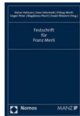
Festschrift für Franz Merli Ladenpreis: 225,20EUR