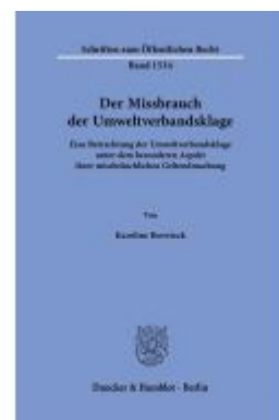
Der Missbrauch der Umweltverbandsklage Ladenpreis: 82,20EUR