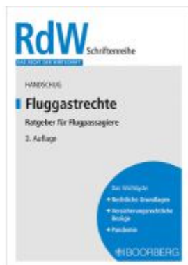
Fluggastrechte Ladenpreis: 20,50EUR