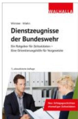
Dienstzeugnisse der Bundeswehr Ladenpreis: 25,70EUR

Wir haben andere Produkte gefunden, die Ihnen gefallen könnten!