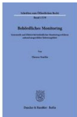
Behördliches Monitoring Ladenpreis: 113,00EUR