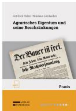
Agrarisches Eigentum und seine Beschränkungen Ladenpreis: 76,00EUR