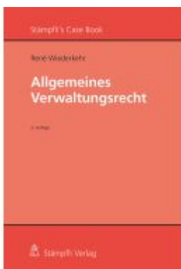
Allgemeines Verwaltungsrecht Ladenpreis: 75,30EUR