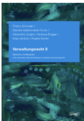
Verwaltungsrecht II Ladenpreis: 99,00EUR