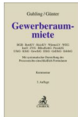
Gewerberaummiete Ladenpreis: 256,00EUR