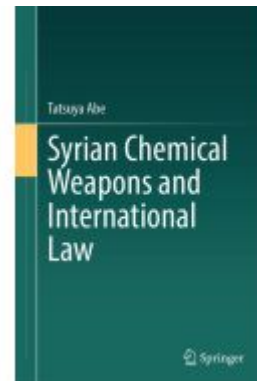
Syrian Chemical Weapons and International Law Ladenpreis: 164,99EUR