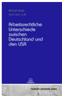
Arbeitsrechtliche Unterschiede zwischen Deutschland und den USA Ladenpreis: 25,60EUR