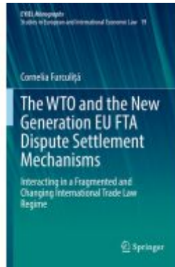
The WTO and the New Generation EU FTA Dispute Settlement Mechanisms