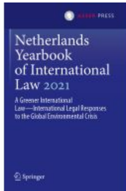
Netherlands Yearbook of International Law 2021