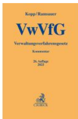
Verwaltungsverfahrensgesetz Ladenpreis: 77,10EUR