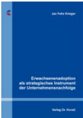
Erwachsenenadoption als strategisches Instrument der Unternehmensnachfolge Ladenpreis: 102,60EUR