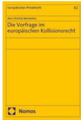
Die Vorfrage im europäischen Kollisionsrecht Ladenpreis: 148,10EUR