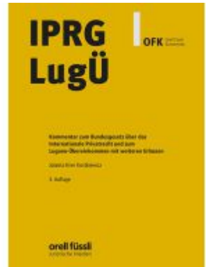
IPRG/LugÜ Kommentar Ladenpreis: 203,60EUR