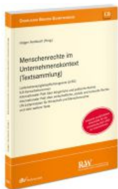
Menschenrechte im Unternehmenskontext (Textsammlung) Ladenpreis: 40,10EUR