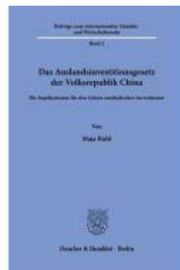
Das Auslandsinvestitionsgesetz der Volksrepublik China Ladenpreis: 102,70EUR