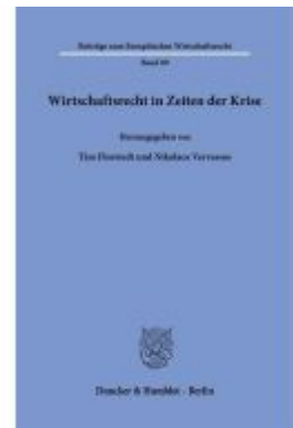
Wirtschaftsrecht in Zeiten der Krise Ladenpreis: 92,50EUR