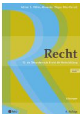
Recht Lösungen (Print inkl. E-Book Edubase, Neuauflage 2025) Ladenpreis: 44,30EUR