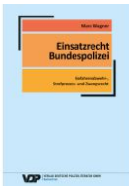
Einsatzrecht Bundespolizei Ladenpreis: 28,80EUR