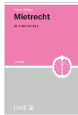
Mietrecht Ladenpreis: 52,00EUR