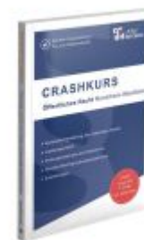
CRASHKURS Öffentliches Recht - NRW Ladenpreis: 26,70EUR

Alle Preise inkl. MwSt. zzgl. Versand. Bei Bestellung im LexisNexis Onlineshop kostenloser Versand innerhalb Österreichs.