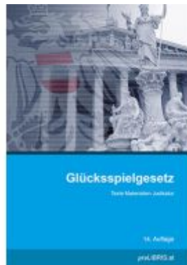
Glücksspielgesetz Ladenpreis: 31,00EUR