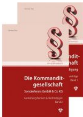
Die Kommanditgesellschaft Set: Band 1 +2 Ladenpreis: 109,00EUR

Wir haben andere Produkte gefunden, die Ihnen gefallen könnten!