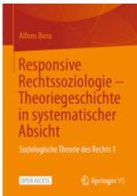
Responsive Rechtssoziologie – Theoriegeschichte in systematischer Absicht Ladenpreis: 43,99EUR