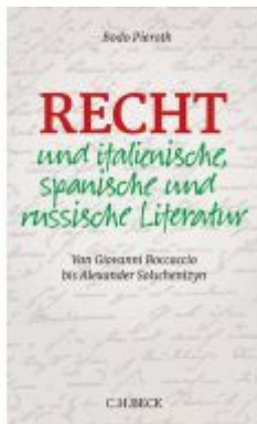
Recht und italienische, spanische und russische Literatur Ladenpreis: 35,90EUR