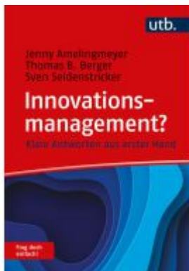
Innovationsmanagement? Frag doch einfach! Ladenpreis: 20,50EUR