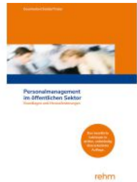
Personalmanagement im öffentlichen Sektor Ladenpreis: 32,90EUR