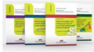
Personalfachkaufleute - Lehrbuch Komplettpaket Handlungsbereich 1 - 4 Ladenpreis: 116,95EUR