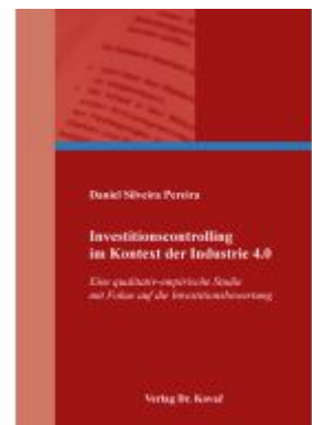
Investitionscontrolling im Kontext der Industrie 4.0 Ladenpreis: 102,60EUR