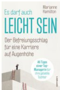
Es darf auch leicht sein Ladenpreis: 20,60EUR