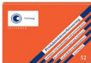
Produktivitätsverbesserung Ladenpreis: 257,10EUR