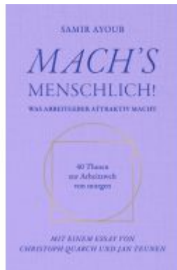
MACH'S MENSCHLICH! Ladenpreis: 20,00EUR