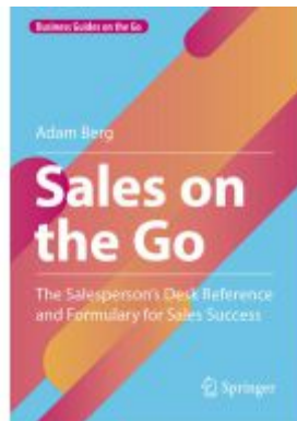
Sales on the Go Ladenpreis: 41,79EUR