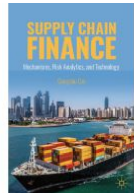
Supply Chain Finance Ladenpreis: 109,99EUR