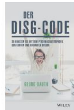
Der DISG-Code Ladenpreis: 25,70EUR