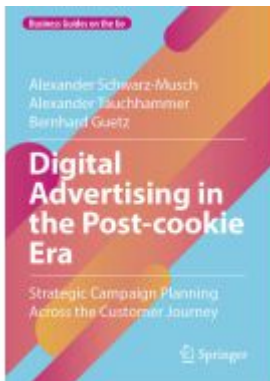
Digital Advertising in the Post-cookie Era Ladenpreis: 43,99EUR

Wir haben andere Produkte gefunden, die Ihnen gefallen könnten!