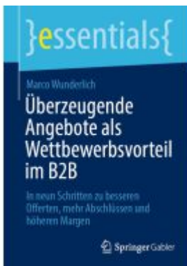
Überzeugende Angebote als Wettbewerbsvorteil im B2B Ladenpreis: 15,41EUR