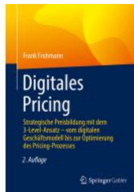
Digitales Pricing Ladenpreis: 71,95EUR