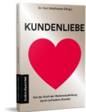
Kundenliebe Ladenpreis: 22,70EUR