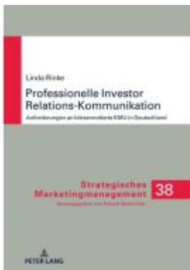
Professionelle Investor Relations- Kommunikation Ladenpreis: 63,70EUR