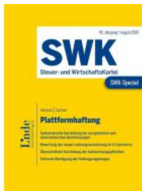
SWK-Spezial Plattformhaftung Ladenpreis: 26,00 EUR

Wir haben andere Produkte gefunden, die Ihnen gefallen könnten!