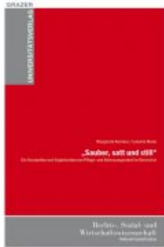
"Sauber, satt und still" Ladenpreis: 18,90 EUR