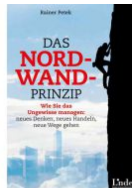
Das Nordwand-Prinzip Ladenpreis: 19,90 EUR