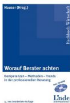
Worauf Berater achten Ladenpreis: 49,00 EUR