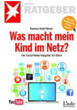
Was macht mein Kind im Netz? Ladenpreis: 9,90 EUR