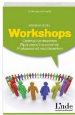
Workshops Ladenpreis: 19,90 EUR