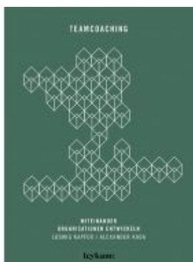
Teamcoaching – Miteinander Organisationen entwickeln Ladenpreis: 28,00 EUR