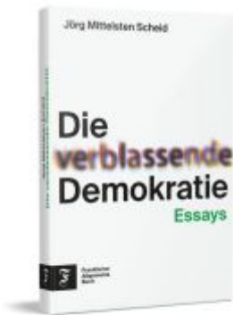
Die verblässende Demokratie Ladenpreis: 26,80EUR