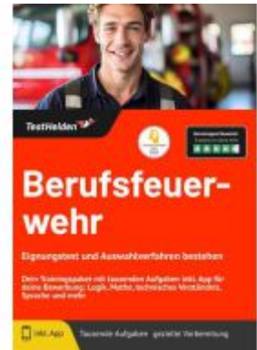
Berufsfeuerwehr Eignungstest und Auswahlverfahren bestehen: Dein Trainingspaket mit tausenden Aufgaben inkl. App für deine Bewerbung: Logik, Mathe, technisches Verständnis, Sprache und mehr Ladenpreis: 41,10EUR