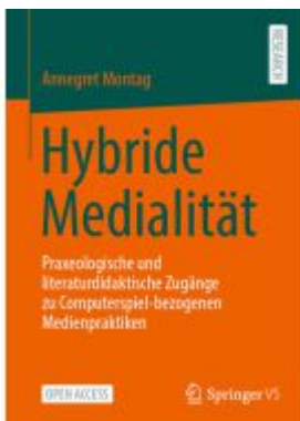
Hybride Medialität Ladenpreis: 82,23EUR

Wir haben andere Produkte gefunden, die Ihnen gefallen könnten!