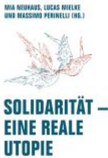
Solidarität – Eine reale Utopie Ladenpreis: 24,70EUR