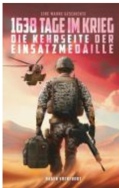
1638 Tage im Krieg Ladenpreis: 20,40EUR