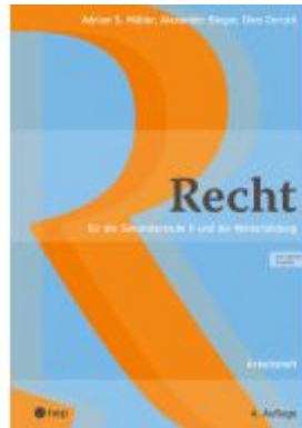
Recht Arbeitsheft (Print inkl. E-Book Edubase, Neuauflage 2025) Ladenpreis: 30,90EUR