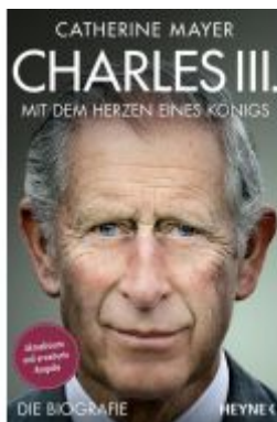
Charles III. – Mit dem Herzen eines Königs Ladenpreis: 16,50EUR