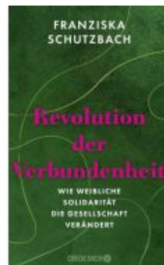
Revolution der Verbundenheit Ladenpreis: 24,70EUR