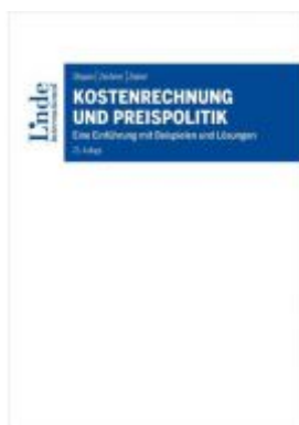
Kostenrechnung und Preispolitik Ladenpreis: 42,00 EUR