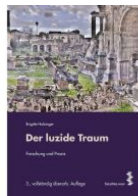
Der luzide Traum Ladenpreis: 22,90 EUR