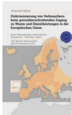
Diskriminierung von Verbrauchern beim grenzüberschreitenden Zugang zu Waren und Dienstleistungen in der Europäischen Union Ladenpreis: 88,00 EUR