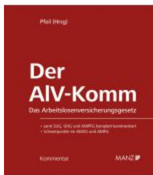
Der ALV-Komm Das Arbeitslosenversicherungsgesetz Ladenpreis: 198,00 EUR