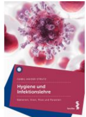
Hygiene und Infektionslehre Ladenpreis: 26,90 EUR