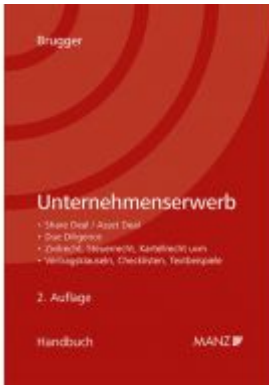
Handbuch Unternehmenserwerb Ladenpreis: 158,00 EUR