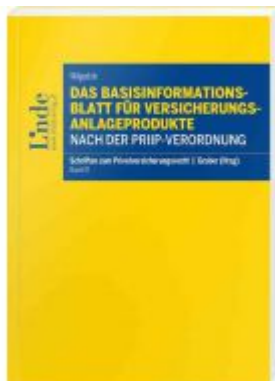
Das Basisinformationsblatt für Versicherungsanlageprodukte nach der PRIIP-Verordnung Ladenpreis: 48,00 EUR

Wir haben andere Produkte gefunden, die Ihnen gefallen könnten!