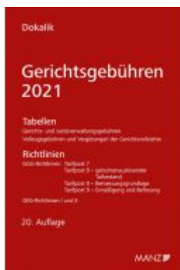
Gerichtsgebühren 2021 Tabellen und Richtlinien Ladenpreis: 32,00 EUR