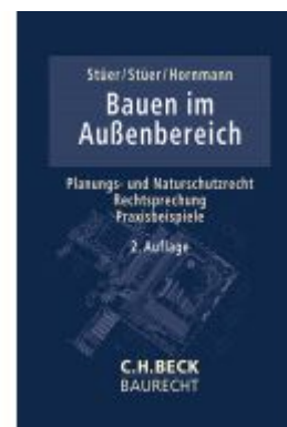
Bauen im Außenbereich Ladenpreis: 132,70EUR