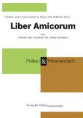
Liber Amicorum Ladenpreis: 38,00EUR