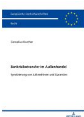
Bankrisikotransfer im Außenhandel Ladenpreis: 61,05EUR