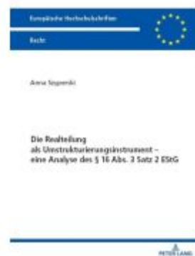
Die Realteilung als Umstrukturierungsinstrument – eine Analyse des § 16 Abs. 3 Satz 2 EStG Ladenpreis: 35,90EUR