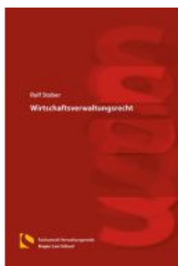
Wirtschaftsverwaltungsrecht Ladenpreis: 70,90EUR