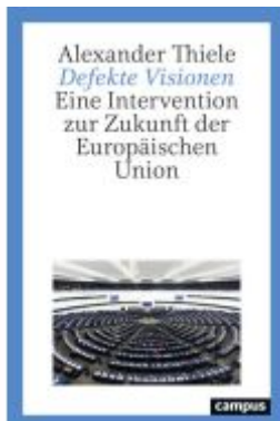
Defekte Visionen Ladenpreis: 22,70EUR