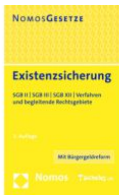
Existenzsicherung Ladenpreis: 16,40EUR