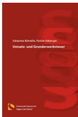
Umsatz- und Grunderwerbsteuer Ladenpreis: 46,30EUR