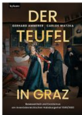
Der Teufel in Graz. Ladenpreis: 39,00 EUR