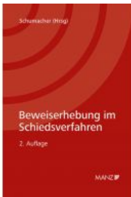
Beweiserhebung im Schiedsverfahren Ladenpreis: 105,00 EUR