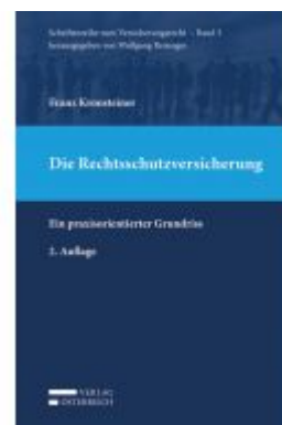
Die Rechtsschutzversicherung Ladenpreis: 69,00 EUR