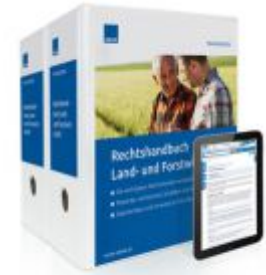
Rechtshandbuch für Land- und Forstwirtschaft Ladenpreis: 207,90 EUR