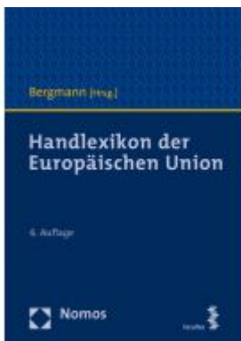
Handlexikon der Europäischen Union Ladenpreis: 100,80 EUR

Wir haben andere Produkte gefunden, die Ihnen gefallen könnten!