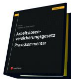
Arbeitslosenversicherungsgesetz - Praxiskommentar Ladenpreis: 290,00 EUR