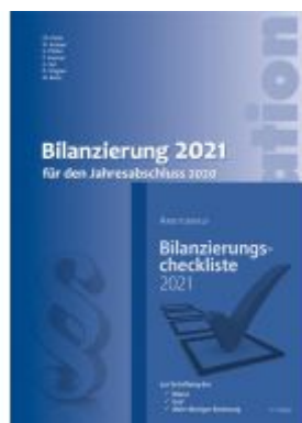
Kombi-Paket Bilanzierung 2021 Ladenpreis: 49,80 EUR