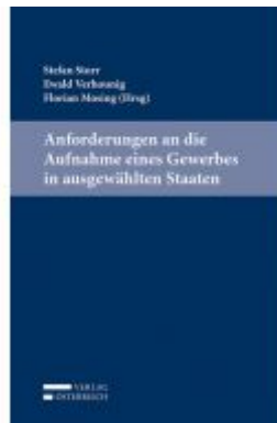
Anforderungen an die Aufnahme eines Gewerbes in ausgewählten Staaten Ladenpreis: 64,00 EUR