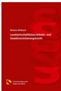
Landwirtschaftliches Arbeits- und Sozial(versicherungs)recht Ladenpreis: 19,50EUR