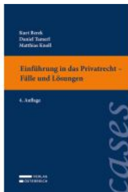
Einführung in das Privatrecht - Fälle und Lösungen Ladenpreis: 29,00EUR