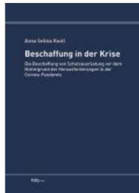
Beschaffung in der Krise Ladenpreis: 40,20EUR