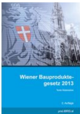
Wiener Bauproduktengesetz 2013 Ladenpreis: 17,00EUR