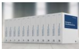
Immobilienbewertung - Lehrbuch und Kommentar Ladenpreis: 319,00EUR