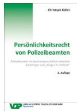
Persönlichkeitsrecht von Polizeibeamten Ladenpreis: 39,10EUR