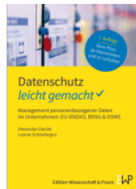
Datenschutz – leicht gemacht. Ladenpreis: 17,40EUR