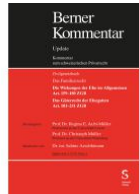
Eherecht, Art. 159-251 ZGB, Grundwerk inkl. 12. Ergänzungslieferung Ladenpreis: 452,40EUR