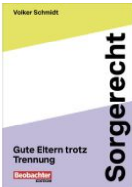
Sorgerecht Ladenpreis: 25,60EUR

Wir haben andere Produkte gefunden, die Ihnen gefallen könnten!