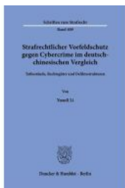
Strafrechtlicher Vorfeldschutz gegen Cybercrime im deutsch-chinesischen Vergleich. Ladenpreis: 92,50EUR