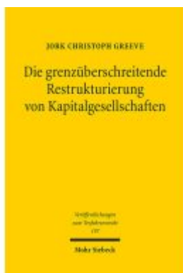
Die grenzüberschreitende Restrukturierung von Kapitalgesellschaften Ladenpreis: 81,30EUR