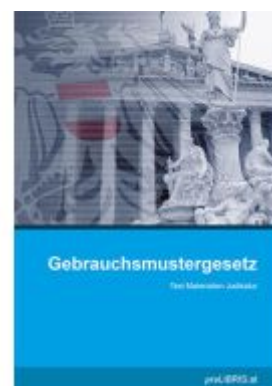
Gebrauchsmustergesetz Ladenpreis: 21,00EUR