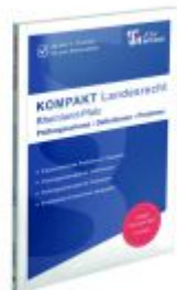
KOMPAKT Landesrecht - Rheinland-Pfalz Ladenpreis: 22,60EUR