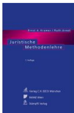
Juristische Methodenlehre Ladenpreis: 68,90EUR