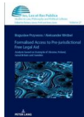
Formalised Access to Pre-judicial Free Legal Aid. Ladenpreis: 61,60EUR