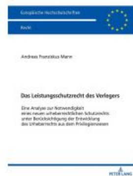
Das Leistungsschutzrecht des Verlegers Ladenpreis: 61,60EUR