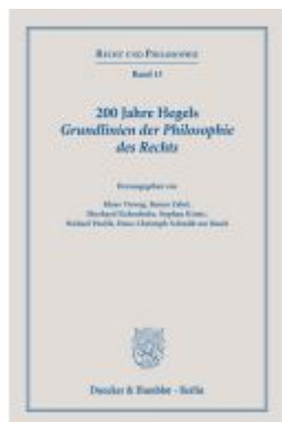
200 Jahre Hegels Grundlinien der Philosophie des Rechts. Ladenpreis: 92,50EUR