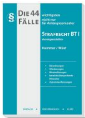
Die 44 wichtigsten Fälle Strafrecht BT I - Vermögensdelikte Ladenpreis: 15,30EUR