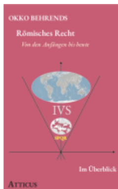
Römisches Recht Ladenpreis: 18,50EUR