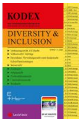
KODEX Diversity & Inclusion Ladenpreis: 40,00EUR