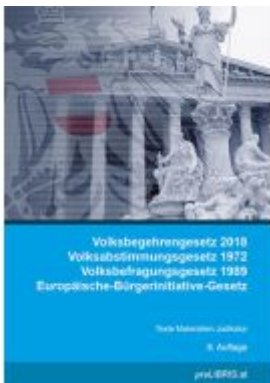
Volksbegehrensgesetz 2018 / Volksabstimmungsgesetz 1972 / Volksbefragungsgesetz 1989 / Europäische-Bürgerinitiative-Gesetz Ladenpreis: 25,00EUR