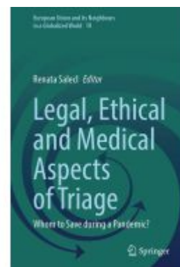
Legal, Ethical and Medical Aspects of Triage Ladenpreis: 186,99EUR