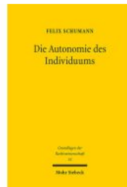
Die Autonomie des Individuums Ladenpreis: 107,00EUR