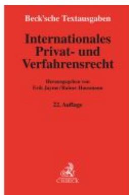
Internationales Privat- und Verfahrensrecht Ladenpreis: 30,80EUR