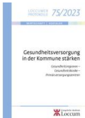
Gesundheitsversorgung in der Kommune stärken Ladenpreis: 13,40EUR