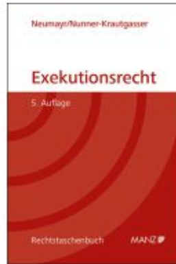
Exekutionsrecht Ladenpreis: 56,00EUR