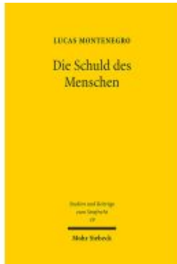
Die Schuld des Menschen Ladenpreis: 86,40EUR