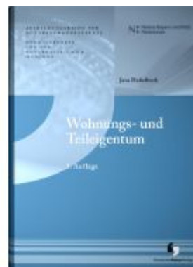
Wohnungs- und Teileigentum Ladenpreis: 25,60EUR