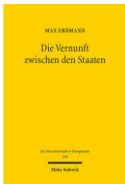
Die Vernunft zwischen den Staaten Ladenpreis: 101,80EUR

Wir haben andere Produkte gefunden, die Ihnen gefallen könnten!