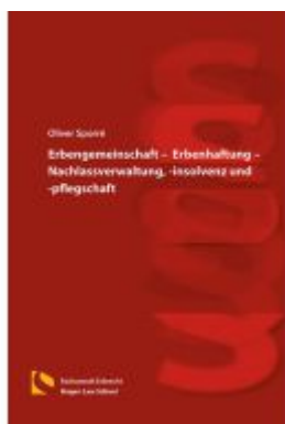
Erbgemeinschaft – Erbenhaftung – Nachlassverwaltung, -insolvenz und - pflugschaft Ladenpreis: 25,70EUR