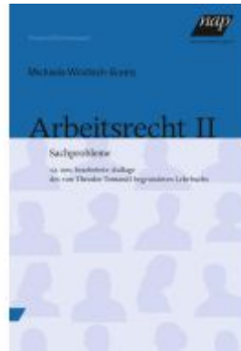
Arbeitsrecht II Ladenpreis: 33,90EUR