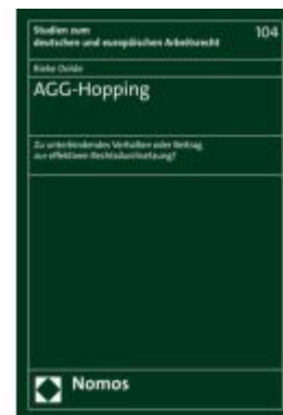
AGG-Hopping Ladenpreis: 65,80EUR