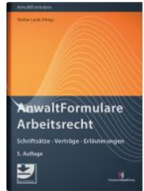
AnwaltFormulare Arbeitsrecht Ladenpreis: 194,30EUR