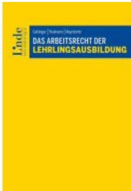
Das Arbeitsrecht der Lehrlingsausbildung Ladenpreis: 79,00EUR