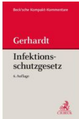
Infektionsschutzgesetz (IfSG) Ladenpreis: 97,70EUR