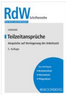
Teilzeitanprüche Ladenpreis: 30,70EUR

Wir haben andere Produkte gefunden, die Ihnen gefallen könnten!