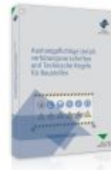
Aushangpflichtige Unfallverhütungsvorschriften und Technische Regeln für Baustellen Ladenpreis: 55,60EUR