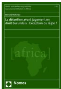
La détention avant jugement en droit burundais : Exception ou règle ? Ladenpreis: 199,50EUR