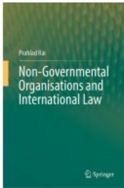
Non-Governmental Organisations and International Law Ladenpreis: 153,99EUR