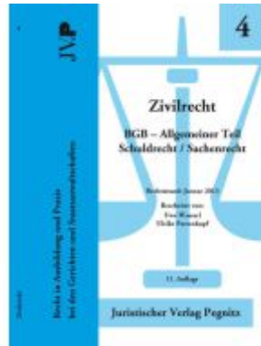
Zivilrecht BGB - Allgemeiner Teil - Schuldrecht/Sachenrecht Ladenpreis: 32,90EUR