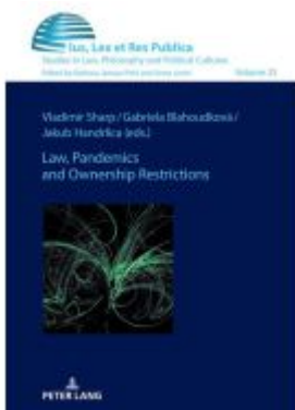
Law, Pandemics and Ownership Restrictions Ladenpreis: 51,40EUR

Wir haben andere Produkte gefunden, die Ihnen gefallen könnten!