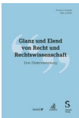
Glanz und Elend von Recht und Rechtswissenschaft Ladenpreis: 41,20EUR