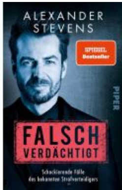
Falsch verdächtigt Ladenpreis: 12,40EUR