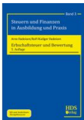
Erbschaftsteuer und Bewertung Ladenpreis: 56,50EUR