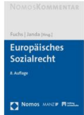
Europäisches Sozialrecht Ladenpreis: 158,00EUR