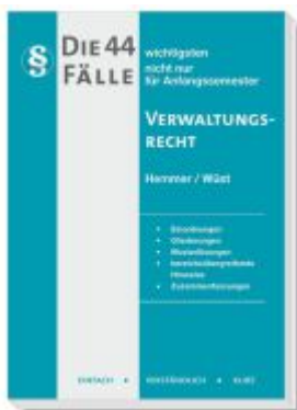
Die 44 wichtigsten Fälle Verwaltungsrecht Ladenpreis: 15,30EUR

Wir haben andere Produkte gefunden, die Ihnen gefallen könnten!