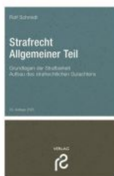
Strafrecht Allgemeiner Teil Ladenpreis: 27,60EUR