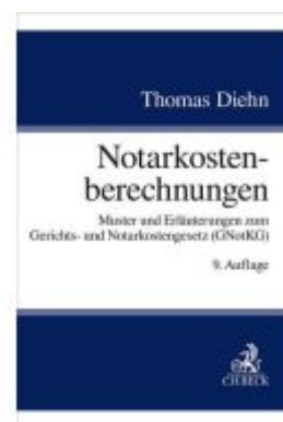
Notarkostenberechnungen Ladenpreis: 46,30EUR