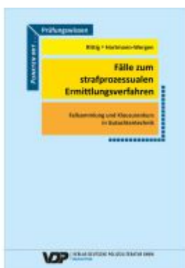
Fälle zum strafprozessualen Ermittlungsverfahren Ladenpreis: 32,90EUR