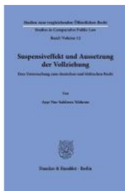
Suspensiv- und Aussetzungseffekt der Vollziehung. Ladenpreis: 92,50EUR