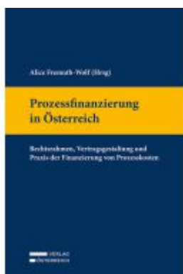
Prozessfinanzierung in Österreich Ladenpreis: 89,00EUR