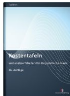
Kostentafeln Ladenpreis: 50,40EUR