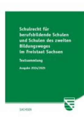
Schulrecht für berufsbildende Schulen und Schulen des zweiten Bildungsweges im Freistaat Sachsen Ladenpreis: 21,50EUR