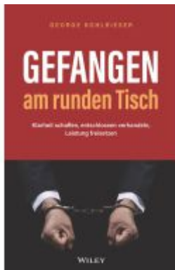
Gefangen am runden Tisch Ladenpreis: 30,90EUR

Wir haben andere Produkte gefunden, die Ihnen gefallen könnten!