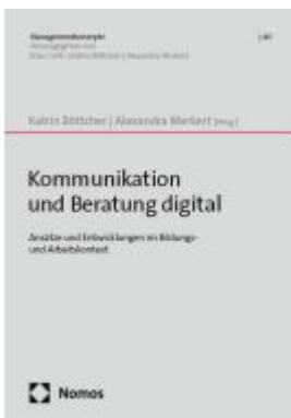
Kommunikation und Beratung digital Ladenpreis: 65,80EUR