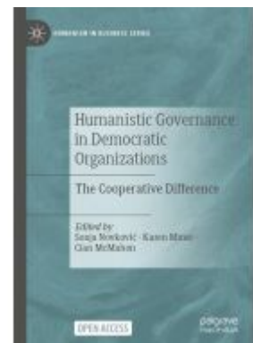
Humanistic Governance in Democratic Organizations Ladenpreis: 43,99EUR