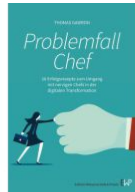
Problemfall Chef. Ladenpreis: 20,50EUR