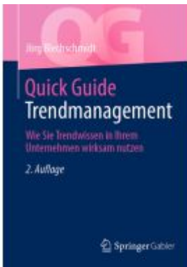
Quick Guide Trendmanagement Ladenpreis: 28,77EUR