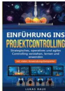
Einführung ins Projektcontrolling Ladenpreis: 16,40EUR