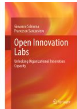
Open Innovation Labs Ladenpreis: 109,99EUR