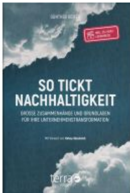
So tickt Nachhaltigkeit. Ladenpreis: 39,60EUR